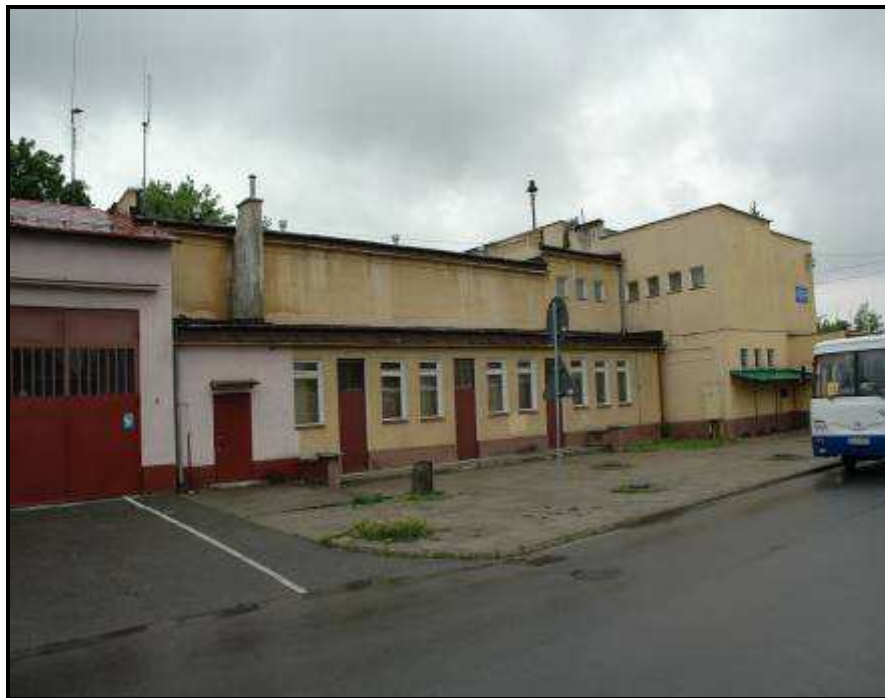
DOM KULTURY I REMIZA STRAŻACKA

Dom Kultury w Pilźnie jest instytucją spełniającą funkcję lokalną, a jej misją jest ochrona i kultywowanie wartości kulturowych środowiska poprzez twórczość ludową edukację kulturalną dzieci i młodzieży, wyzwalanie aktywności kulturalnej w środowisku, stwarzanie warunków kulturalnego spędzania wolnego czasu. Adresatami są szkoły, przedszkola, organizacje społeczne, mieszkańcy miasta i gminy Pilzno. W celu wypracowania aktywnego uczestnictwa w kulturze całego społeczeństwa gminy proponowane są różnorodne formy kół zainteresowań tj.: zajęcia taneczne, teatralne, plastyczne, ognisko muzyczne, rytmika dla dzieci przedszkolnych. W Domu Kultury odbywają się również kursy języków obcych oraz zajęcia aerobikowe.