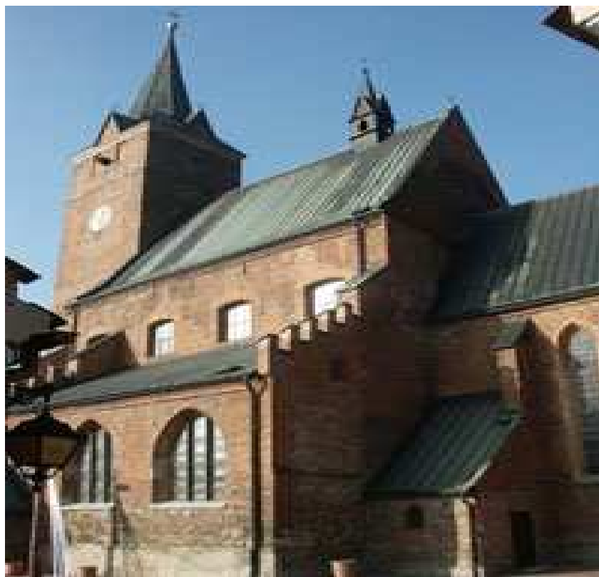
Kościół p.w. Jana Chrzciciela

Do najciekawszych zabytków w Pilźnie możemy zaliczyć : Kościół Parafialny z XV w, Kościół Ojców Karmelitów z XIX w, zachowane fragmenty murów obronnych, zabytkowe kamieniczki w zabudowie miejskiej, cmentarz parafialny, żydowski, oraz z I i II wojny światowej a także budynek Sokoła.