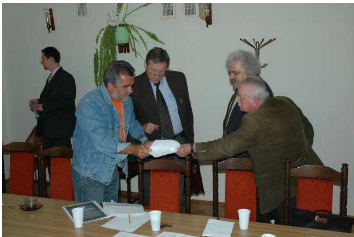
Spotkania konsultacyjne „Programu Rewitalizacji Obszaru Miejskiego Pilzna na lata 2006-2015”- w dniach 24. 05.2006 r i 12 czerwca 2006 r.