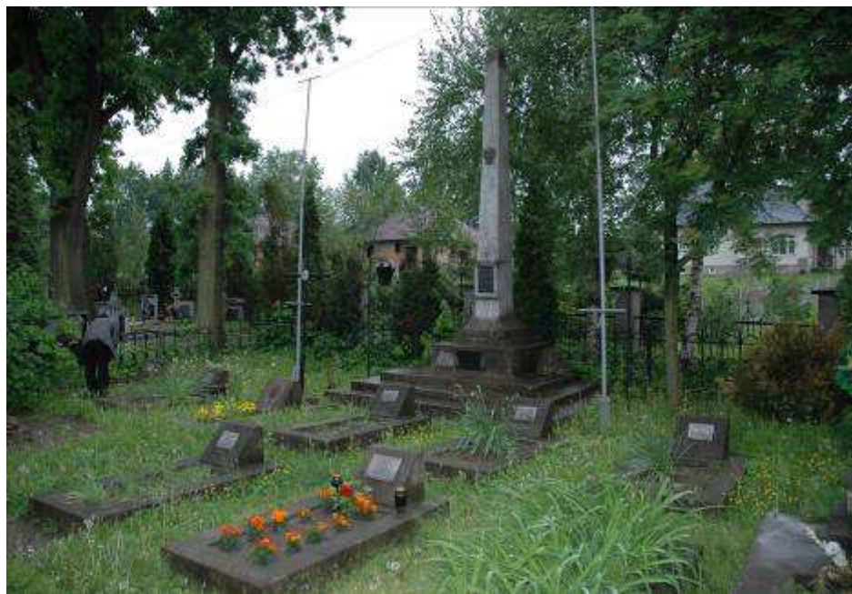
Cmentarz z II wojny światowej