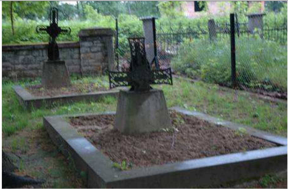
Cmentarz z I wojny światowej