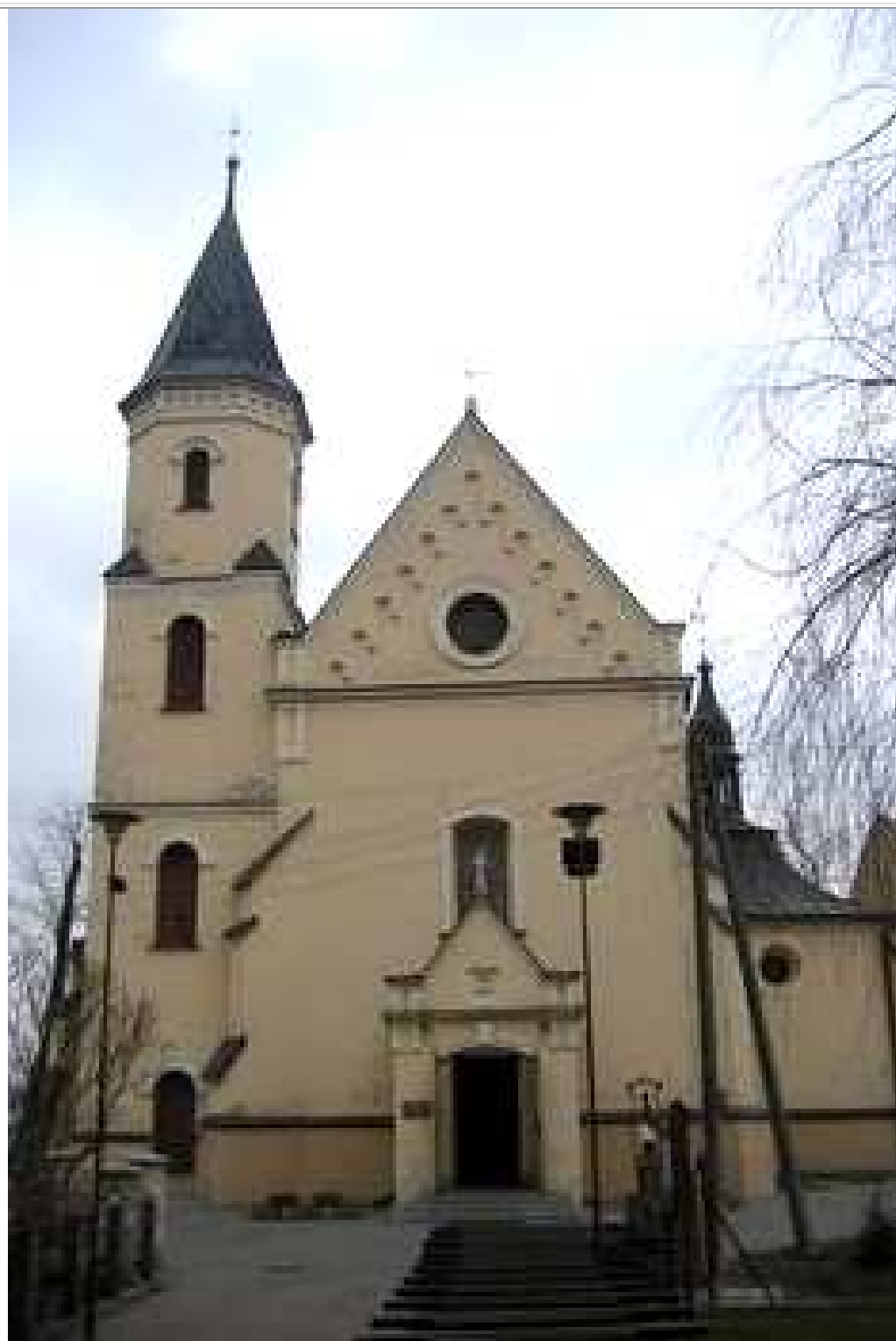
Klasztor OO Karmelitów